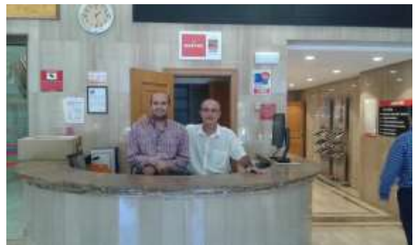
Usuario realizando prácticas profesionales de conserje en Mapfre-Málaga

Para 2018 tenemos previsto la firma de convenio con el Ayuntamiento de Málaga y con la Delegación provincial de Igualdad y Políticas sociales para que usuarios/as de nuestro Área de empleo realicen prácticas profesionales en estos organismos, que les sirva como primera experiencia laboral y como entrenamiento de las habilidades sociolaborales.